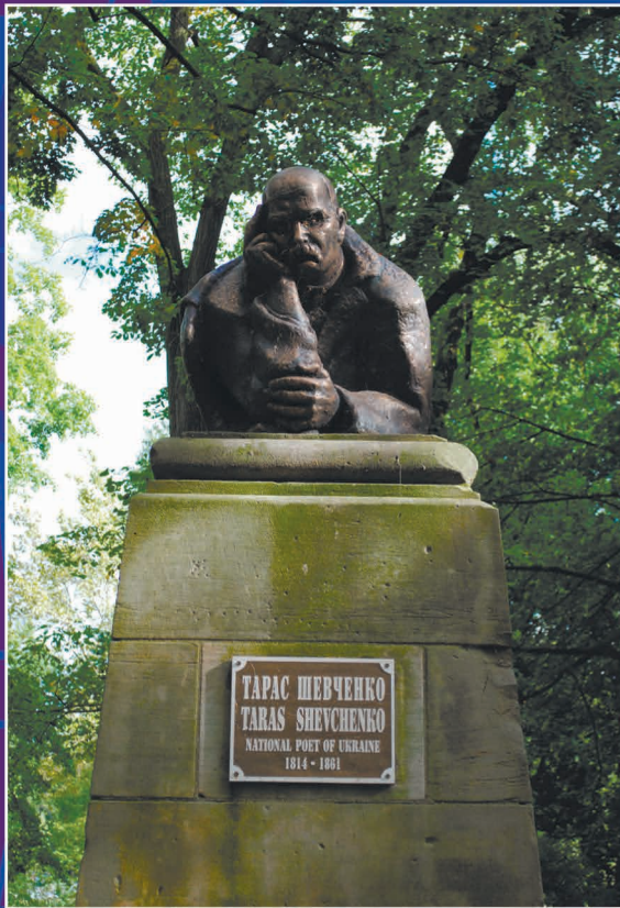
Олександр Архипенко (1887–1964) Пам'ятник Т. Шевченку у Клівленді (США)